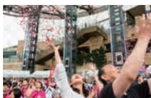
ピンクリボンフェスティバル