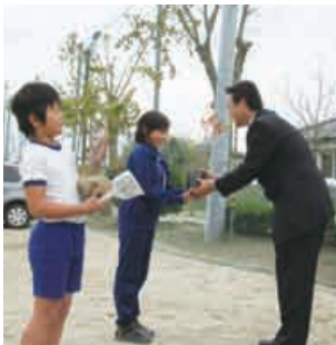
苗木プレゼントの様子

当社は、「緑・自然を守り、親から子へと美しい緑の街を伝えたい」という願いを込めて、昭和49年に「苗木プレゼント」を開始しました。これは、当社が常に訴え続けてきたキャンペーンテーマ「こわさないでください。自然。愛。いのち。」を言葉で終わらせることなく、CSR活動の一環として形で表現したものです。全国の企業、公共団体、学校、病院などの団体及び一般家庭に対して、気候や生育条件にあった苗木を配布し続け、平成26年度で41回目を迎えました。これまでに贈呈した苗木の本数は累計で493万本になりました。苗木は全国各地ですくすくと育ち、心地よい木陰をつくりながら周辺環境の保護やCO 2 削減等に役立っています。