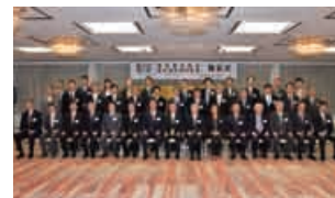
医学研究助成・医学研究特別助成 贈呈式

三井生命厚生財団は、国民の健康保持とその増進をはかり、社会公共の福祉に貢献することを目的として昭和42年に設立されました。この目的に沿い、今日のわが国の健康上の重要課題である生活習慣病に関連する医学研究助成事業等を設立以来一貫して行っています。