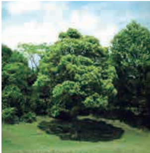
第1回プレゼントの際に植樹した苗木

当社は、「緑・自然を守り、親から子へと美しい緑の街を伝えたい」という願いを込めて、昭和49年に「苗木プレゼント」を開始しました。これは、当社が常に訴え続けてきたキャンペーンテーマ「こわさないでください。自然。愛。いのち。」を言葉で終わらせることなく、CSR活動の一環として形で表現したものです。全国の企業、公共団体、学校、病院などの団体及び一般家庭に対して、気候や生育条件にあった苗木を配布し続け、平成27年度で42回目を迎えました。これまでに贈呈した苗木の本数は累計で498万本になりました。苗木は全国各地ですくすくと育ち、心地よい木陰をつくりながら周辺環境の保護やCO 2 削減等に役立っています。