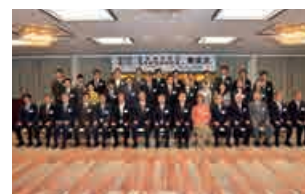
医学研究助成・医学研究特別助成 贈呈式

三井生命厚生財団は、国民の健康保持とその増進をはかり、社会公共の福祉に貢献することを目的として昭和42年に設立されました。この目的に沿い、今日のわが国の健康上の重要課題である生活習慣病に関連する医学研究助成事業等を設立以来一貫して行っています。