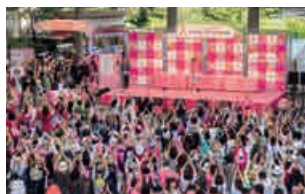
ピンクリボンフェスティバル2015(スマイルウオーク東京大会)の様子

日本では現在、女性の12人に1人が乳がんにかかると言われていますが、乳がん検診受診率はまだ低い状況です。そうした背景の中、乳がんの早期発見啓発を行う運動がピンクリボン運動です。