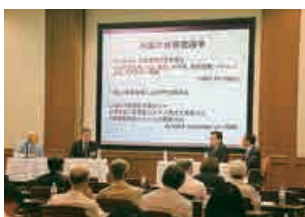
第23回ミツイライフ・国際シンポジウム

平成2年に米国ミシガン大学ロス・ビジネススクールに設置され、世界経済の最新情報をもとに、正確な調査・分析から日本と世界の金融制度および市場経済の研究を行っています。平成26年度には、第23回ミツイライフ・国際シンポジウムが都内で開催され、日米の有識者による講演やパネルディスカッションが行われました。