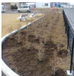
2017年3月 土岡河原公園(青森県八戸市)