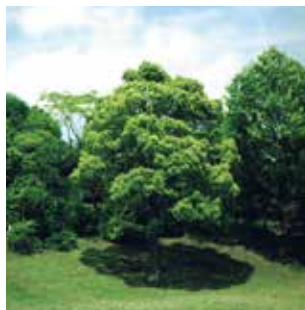
第1回プレゼントの際に植樹した苗木