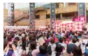
ピンクリボンフェスティバル2018(スマイルウオーク東京)の様子