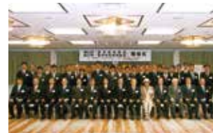
医学研究助成・医学研究特別助成 贈呈式

当社は、生命・健康と密接な関係を持つ生命保険業を本業とする会社として、また、女性従業員の割合が高い企業として、ピンクリボン運動の趣旨に賛同し、この運動に参画しています。具体的には、多くの方に乳がんの早期発見の大切さを伝える「ピンクリボンフェスティバル」(公益財団法人日本対がん協会など主催)への協賛、乳がんセミナーの実施、チラシなどを用いたお客さま・地域の方々への乳がんについての情報提供や啓蒙活動などを行っています。