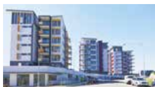
オーストラリアの中低所得者向け住宅の整備プログラムに役立っています。

当社では、「社会・環境」問題への取組みの一環として、ESG投資を進めています。ESG投資への取組みは、グリーンボンドやソーシャルボンドなどへの投資を通じて行っており、2018年度末の投資残高は928億円となっています。投資した資金は国際開発金融機関などを通じて、開発途上国などにおける貧困の撲滅、中低所得者の生活支援、生物圏保護プロジェクト、再生エネルギーの生成プロジェクトなどに活用されています。