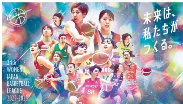
第24回Wリーグ 公式ポスターデザイン